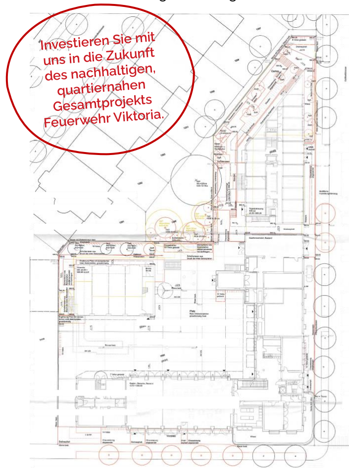
Legende: Situationsplan nach Verschiebung Saalbau / Neubauprojekt.

Das Wohnbauprojekt ist zudem explizit als integraler Teil der Gesamtnutzung des Areals geplant: Unser Fokus liegt auf dem Teilen und dem gemeinsamen Nutzen von Infrastruktur und Räumen mit den gewerblichen und kulturellen Betrieben, ihren Gästen und ihrer Kundschaft.