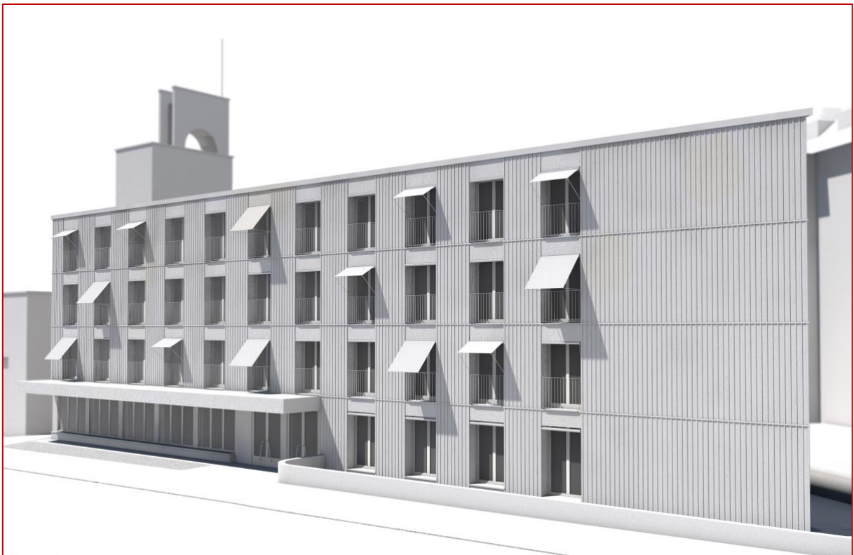
Legende: Visualisierung Ostfassade Neubau «Albert» gemäss Baueingabe.

Für weitere Fragen stehen wir Ihnen gerne zur Verfügung. Zum Mitmachen füllen Sie bitte die folgenden Talons aus. Herzlichen Dank schon im Voraus.