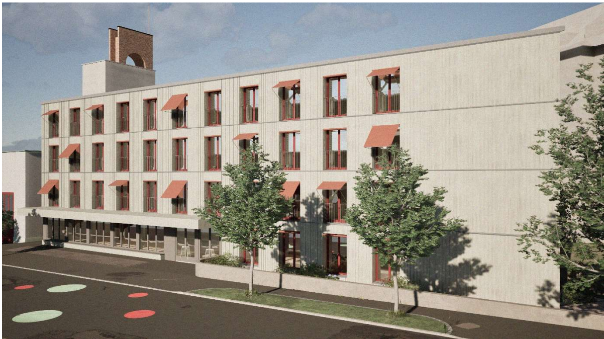
Legende: Visualisierung Ostfassade Neubau «Albert» gemäss Baueingabe.

Für weitere Fragen stehen wir Ihnen gerne zur Verfügung. Zum Mitmachen füllen Sie bitte die folgenden Talons aus. Herzlichen Dank schon im Voraus.