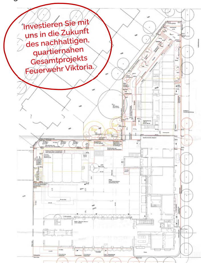
Legende: Situationsplan nach Verschiebung Saalbau / Neubauprojekt.

Das Wohnbauprojekt ist zudem explizit als integraler Teil der Gesamtnutzung des Areals geplant: Unser Fokus liegt auf dem Teilen und dem gemeinsamen Nutzen von Infrastruktur und Räumen mit den gewerblichen und kulturellen Betrieben, ihren Gästen und ihrer Kundschaft.